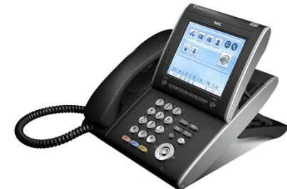
DT750IP多機能電話機 【 ITL-320C-1D(BK)TEL 】