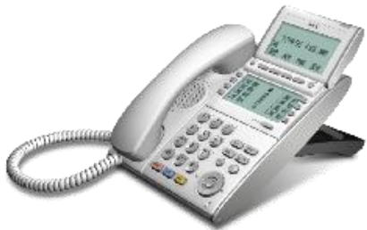
デジレスデジタル多機能電話機 【 DTL-8LD-1D(WH)TEL 】

示名条(ラインカード)がデジタルの電話機として以下3機種をラインナップしております。 移設/増設時にラインカードを差し替えることなくデータ変更でラインキーを一括変更可能です。