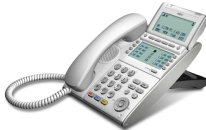
デジレスIP多機能電話機 【 ITL-8LD-1D(WH)TEL 】